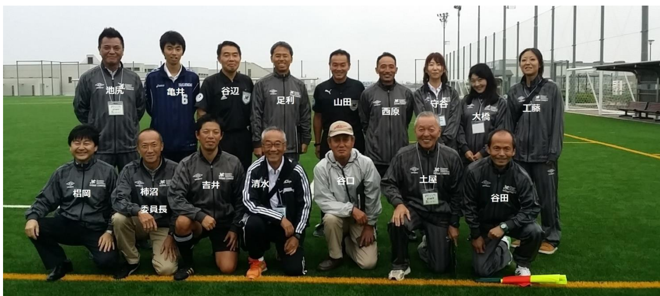
～ 船橋市サッカー協会審判委員会の皆さま ～